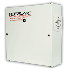
PC-B15T PC-15T Carcasa con campanilla y que aloja Bateria de respaldo